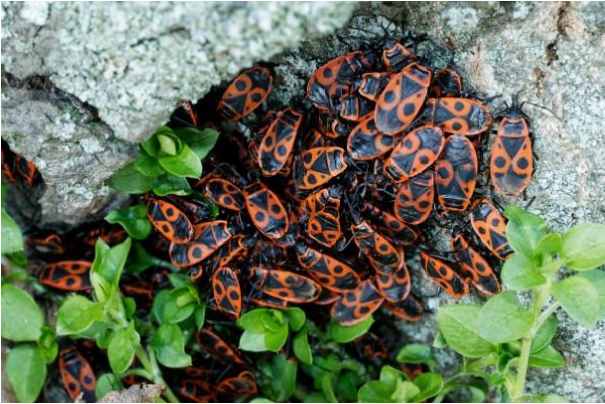
Een familie zonnende Vuurwantsen