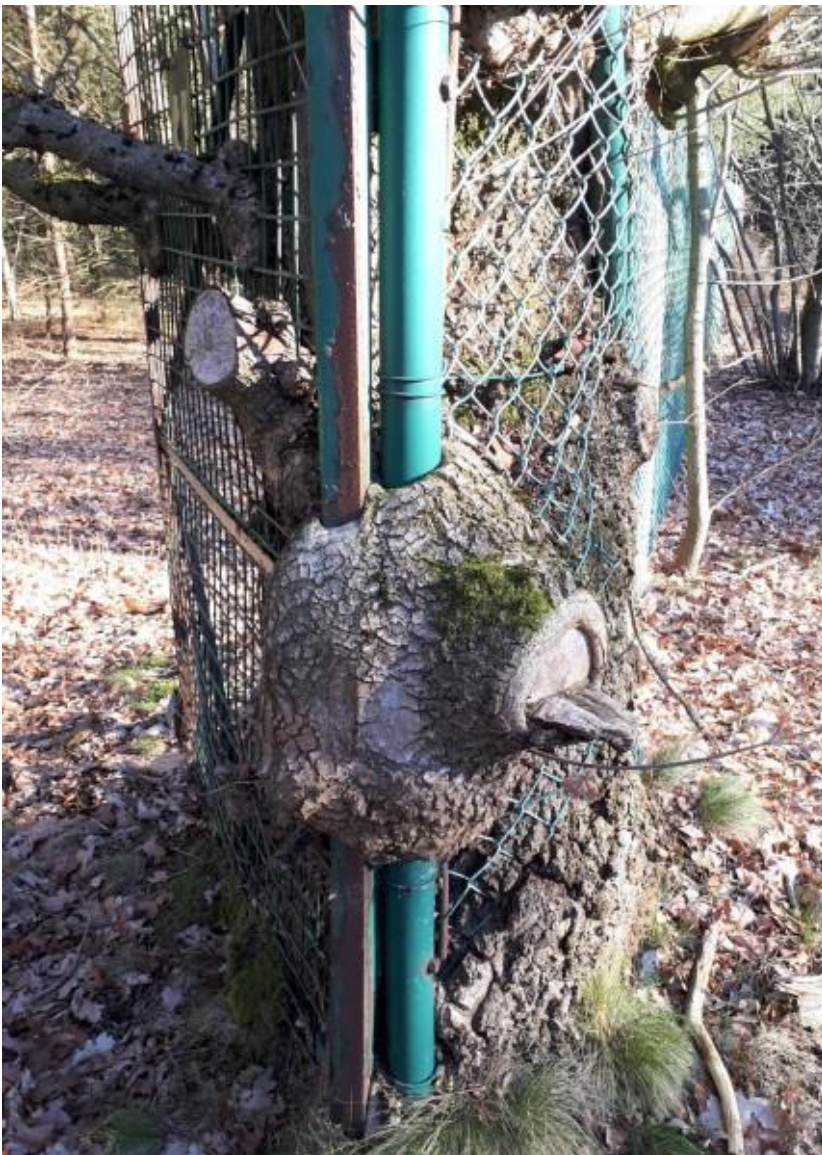
Het kon uit een griezelfilm komen: Boom verzwelgt poortje